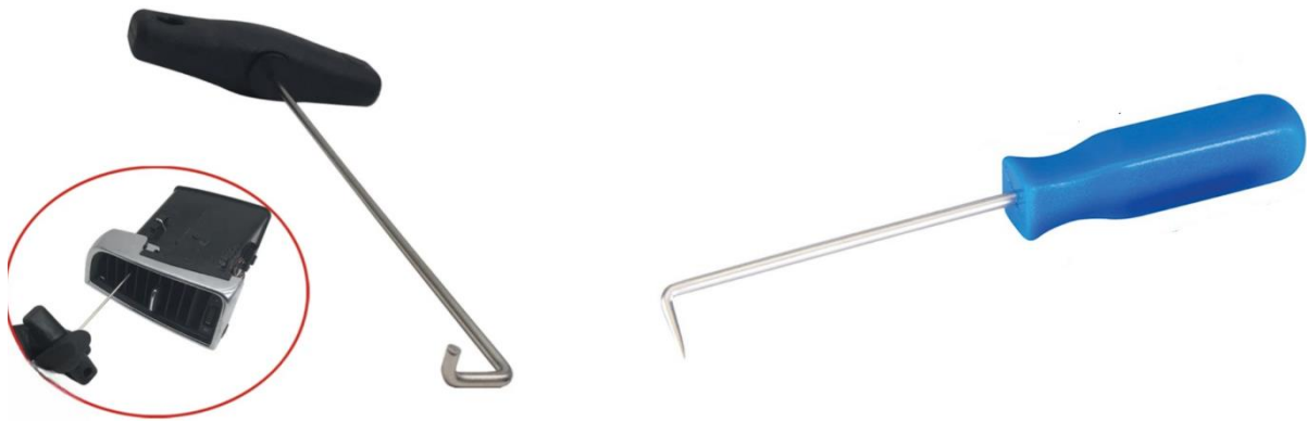
Figure 1 : Crochets à dégagement spécial, Figure 2 : Crochets simples

Les bouches d'aération sont enclenchées en 4 points chacune. Les clips A et B sont les clips de libération réels. Ceux-ci peuvent être retirés à l'aide de crochets spéciaux (voir Figure 1). La même opération peut également être effectuée avec deux crochets simples (voir Figure 2).